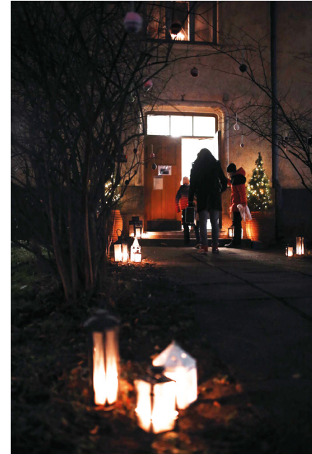
Ti 22.11. Lyhtytyöpaja