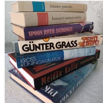
SU 27.11. Vaihdetaan ja viihdytään! - Kirjojen vaihtotapahtuma

kuvista syntyivät projektin avainkuvat teemoittain eteneviin kuvasarjoihin, jotka muodostavat nyt nähtävän meditatiivisen kuvaesityksen. Minne nämä kuvat sinut vievät, mitä mieleesi tuovat? Vapaa pääsy.