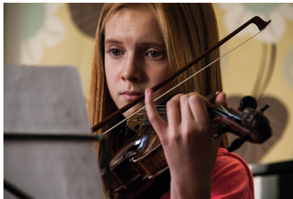
SU 20.11. Kallion Musiikkikoulu, Avoimien ovien päivä