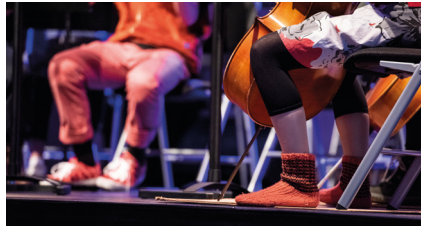
LA 26.11. Reilun soiton päivä

Tapahtuma on kaiken kokoisille ja ikäisille. Tapahtuman järjestävät alueen musiikkioppilaitokset Kallion musiikkikoulu, Keski-Helsingin musiikkiopisto ja Resonaarin musiikkiopisto. Vapaa pääsy. Tervetuloa!