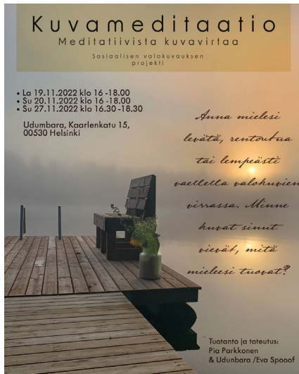
SU 27.11. Kuvameditaatio

KLO 13 - 15 KALLIOLAN SETLEMENTTITALON AULA, STURENKATU 11