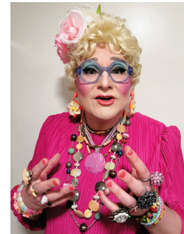
LA 19.11. Maimu Brushwood