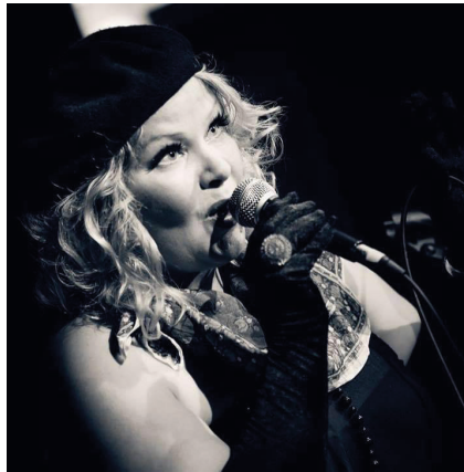
TO 24.11. Trio Gigi